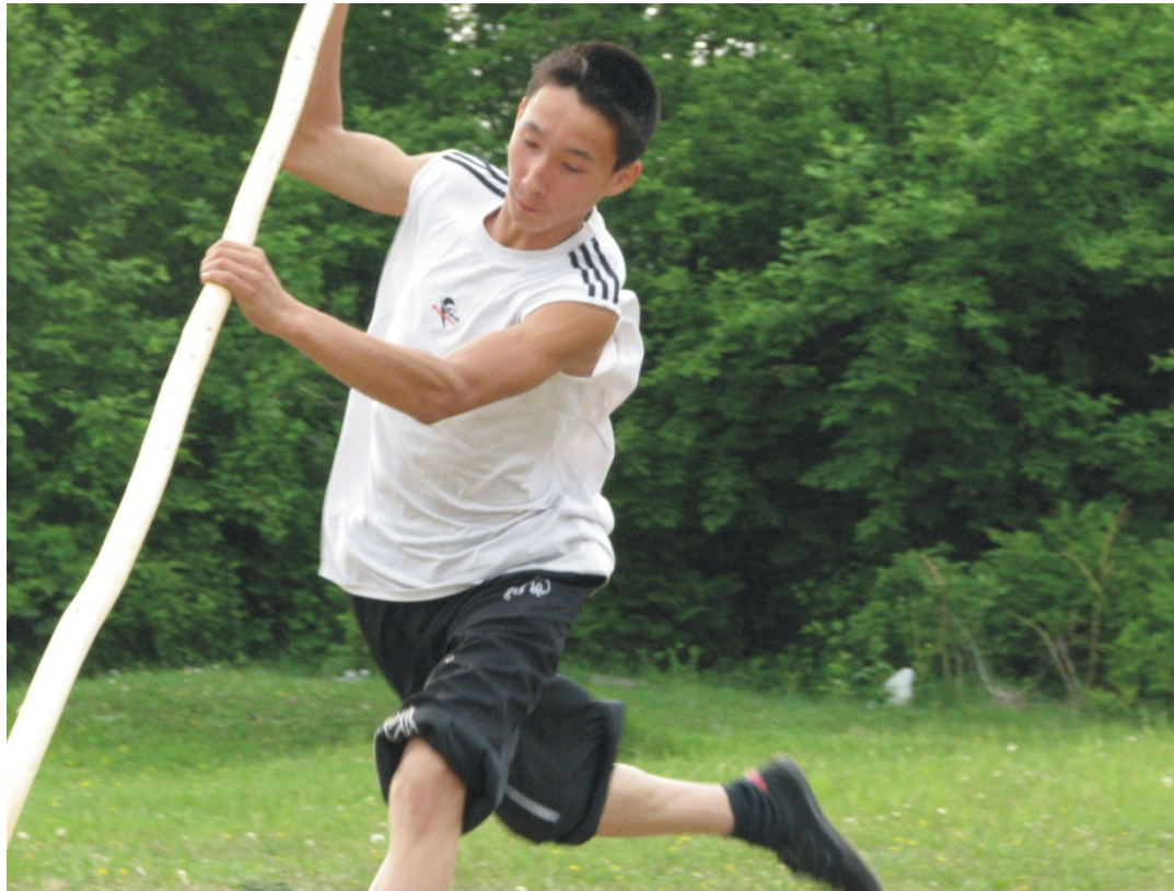
Рис. 32. Подготовка к традиционному многоборью. Прыжок через “ручей” с шестом (нанайцы).