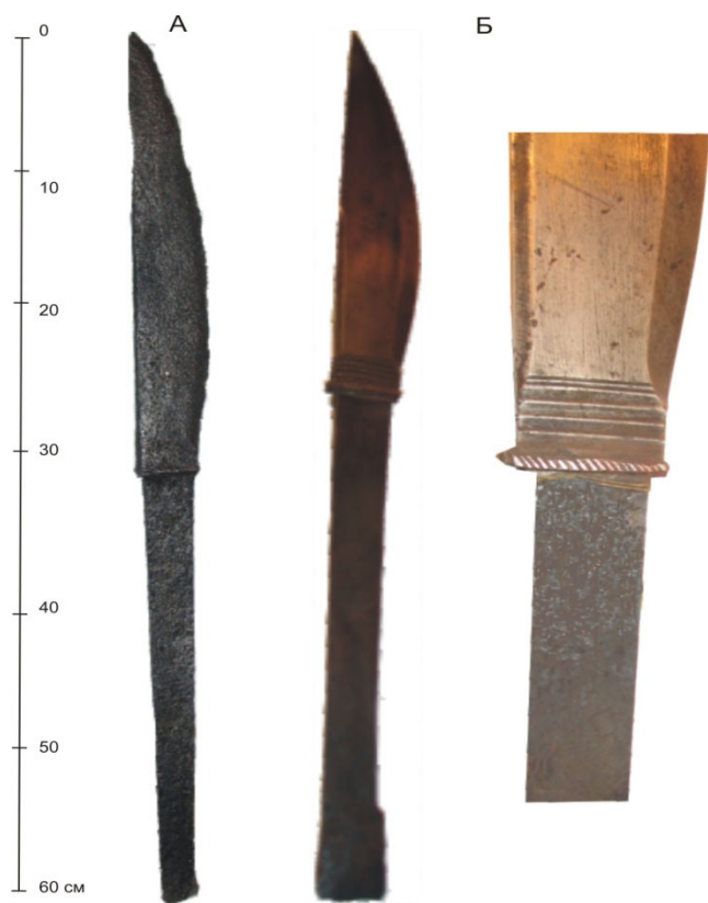
Рис. 15. Пальма. А - МАЭ: колл. 5334-17. Б - МАЭ: колл. 344-48а (нанайцы).