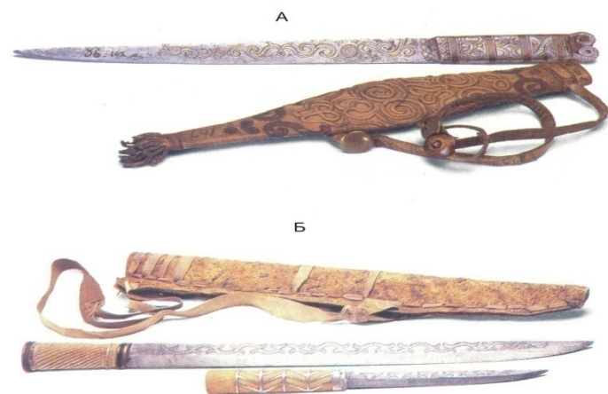
Рис. 28. А - Нож и ножны. МАЭ: колл. 36-162а,б (нивхи). Б - Нож и ножны. AMNH - American Museum of Natural History 70/3655a,b; 70/3441 (коряки).